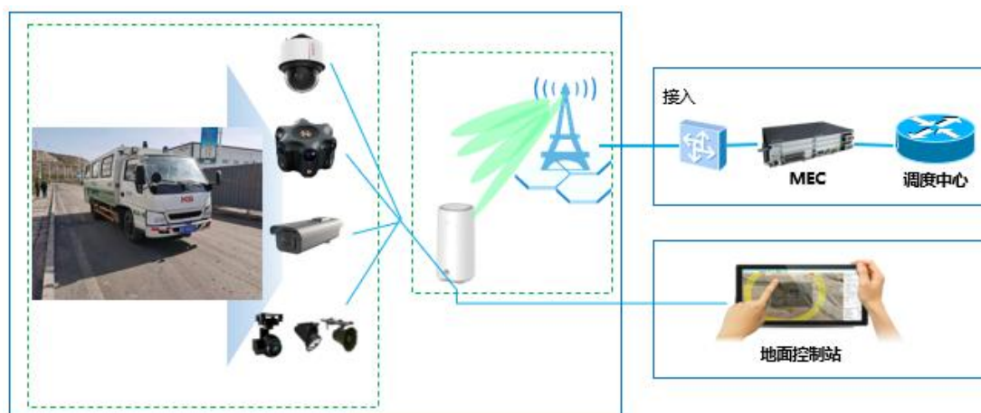
图：测试床5G井下无轨胶轮车无人驾驶应用方案

雷达、高清摄像头、差分GPS定位等数据采集终端和车辆控制终端实现无轨胶轮车改装工作，基于边缘计算能力和矿山无人调度系统平台，利用无人驾驶感知模块、地下矿区RTK定位方案以及无人驾驶控制系统实现无轨胶轮车无人驾驶。