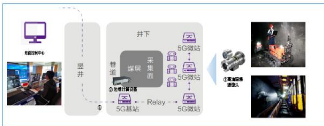
图：测试床高清视频监控应用方案

利用5G大带宽、低时延的特点，通过井下高清视频采集终端实时采集高清视频并回传至地面监控平台，并基于机器视觉技术实现人员行为异常、设备故障、环境突发等不安全因素智能识别。麻地梁智慧矿山利用5G大带宽特性，配套自动除尘高清摄像头，实现井下综采、掘进工作面以及其他监控场景多路高清视频监控回传，助力井下透明化，实现地面控制中心对井下采掘情况实时监控。