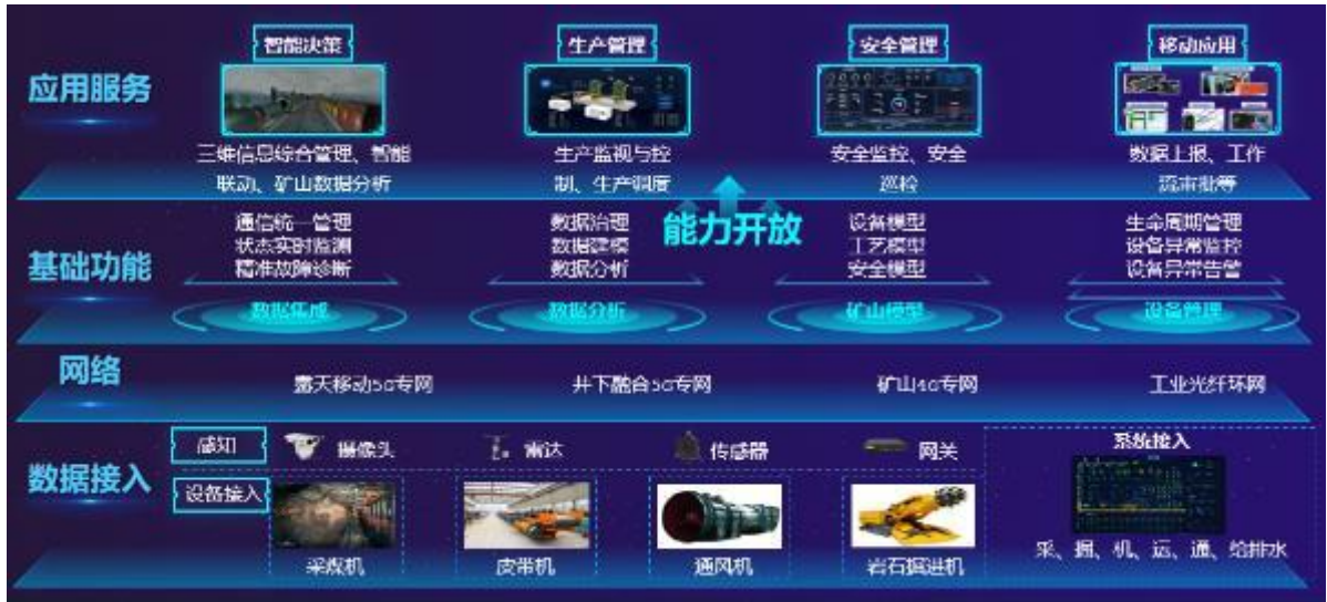
图：测试床平台方案