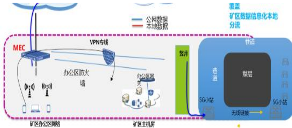
图：测试床网络方案