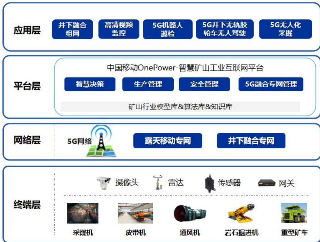
图：测试床总体架构

本测试床符合AII工业互联网总体架构2.0, 本测试床架构验证了AII总体架构中的功能架构, 包括网络体系架构中的网络互连、数据互通, 平台体系架构中的边缘层、PaaS 层和应用层功能组成, 安全体系架构中的隐私数据保护等。