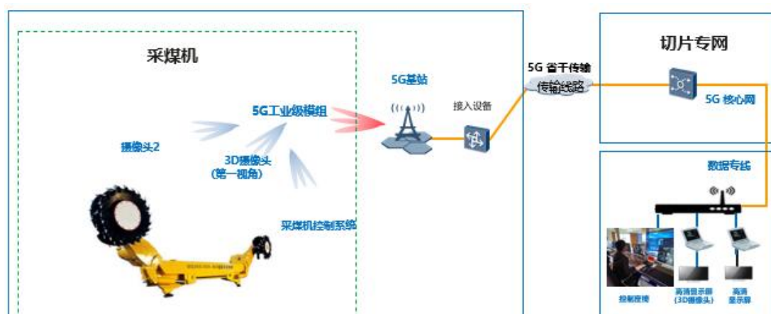
图：5G+无人化采掘系统示意图

基于5G专用网络，在井下采煤机远程控制本体加装5G工业级模组、远程操控系统及配套的控制传感以及视频监控终端，替代原先5G+CPE的过渡方案，同时基于远程控制操作台和视频监控平台，实现井下采煤机真正的5G远程操控，一键启停，成为改写煤炭行业发展历史的创新成果。